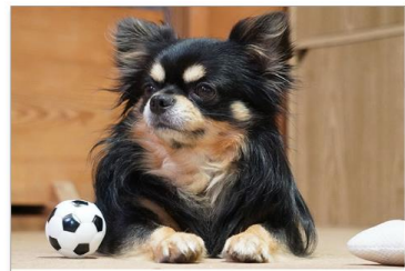
愛犬・愛猫との暮らしを、もっと豊かに楽しくするために

各ページには問い合わせフォームも兼ね揃えており、気になった項目からすぐにお問い合わせいただけます。