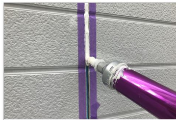
10年目以降もお家の保険を延長するために(屋根・外壁補修)