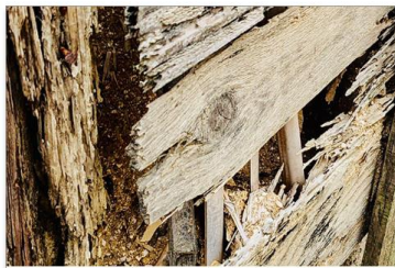
シロアリ予防の効果は5年、あなたの家は大丈夫?