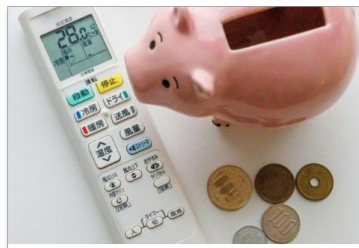
環境と家計にやさしい。すぐできるエアコン節電対策