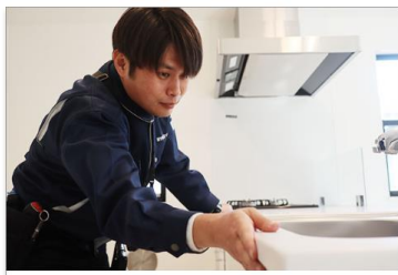
知らないと損する!住まいの点検のススメ